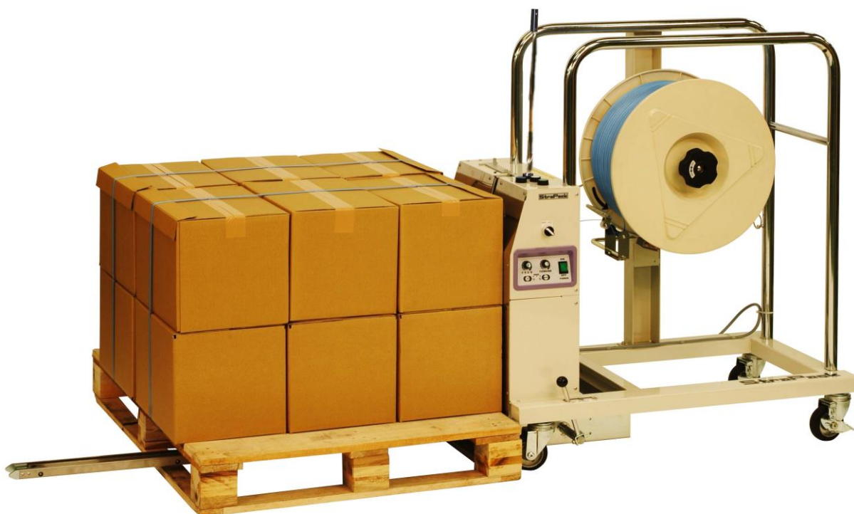
Na zdjęciu: wiązarka STRAPACK D53-PLT2.

Wiązarka D53-PLT2 japońskiej firmy STRAPACK jest maszyną o nietypowym zastosowaniu. W odróżnieniu od większości innych maszyn STRAPACKa – jest przeznaczona do pionowego obwiązywania palet , a nie paczek i kartonów. Maszyna zakłada wiązania pionowe, przy czym wysokość lancy podającej taśmę (a tym samym wysokość wiązań) może być regulowana.