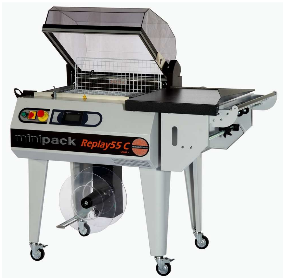
Na zdjęciu: maszyna do pakowania produktów w folię termokurczliwą, REPLAY-55 C EVO, włoskiej firmy MINIPACK-TORRE

Włoski producent doskonałych maszyn kloszowych – MINIPACK-TORRE uczynił spory postęp technologiczny i diametralnie rozwinął znaną i cenioną linię maszyn kloszowych. Oprócz ładniejszego designu maszyny te otrzymały szereg unikalnych rozwiązań, dzięki którym stały się najnowocześniejszymi i najlepszymi maszynami w swojej klasie.